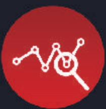
Análisis del Valor Ganado